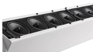
Front ohne Gitter