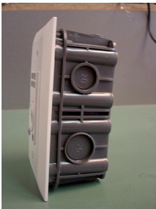
Standart EB-Dose GR.1.1