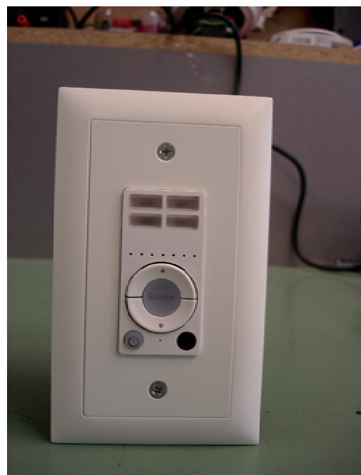
Frontansicht fertig eingebaut